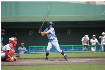
【2安打1得点と打線も引っ張った芳賀君】